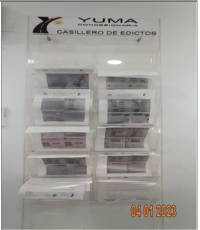
EDICTO R_36221 YC-CRT-122719